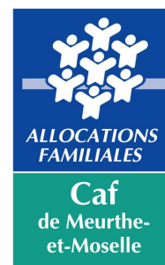
Schéma local de développement de l'accueil des jeunes enfants